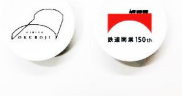
※2枚1組、画像はイメージです