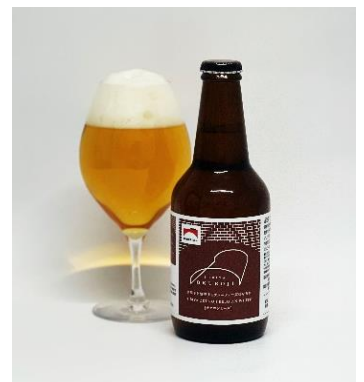
※330ml瓶、画像はイメージです